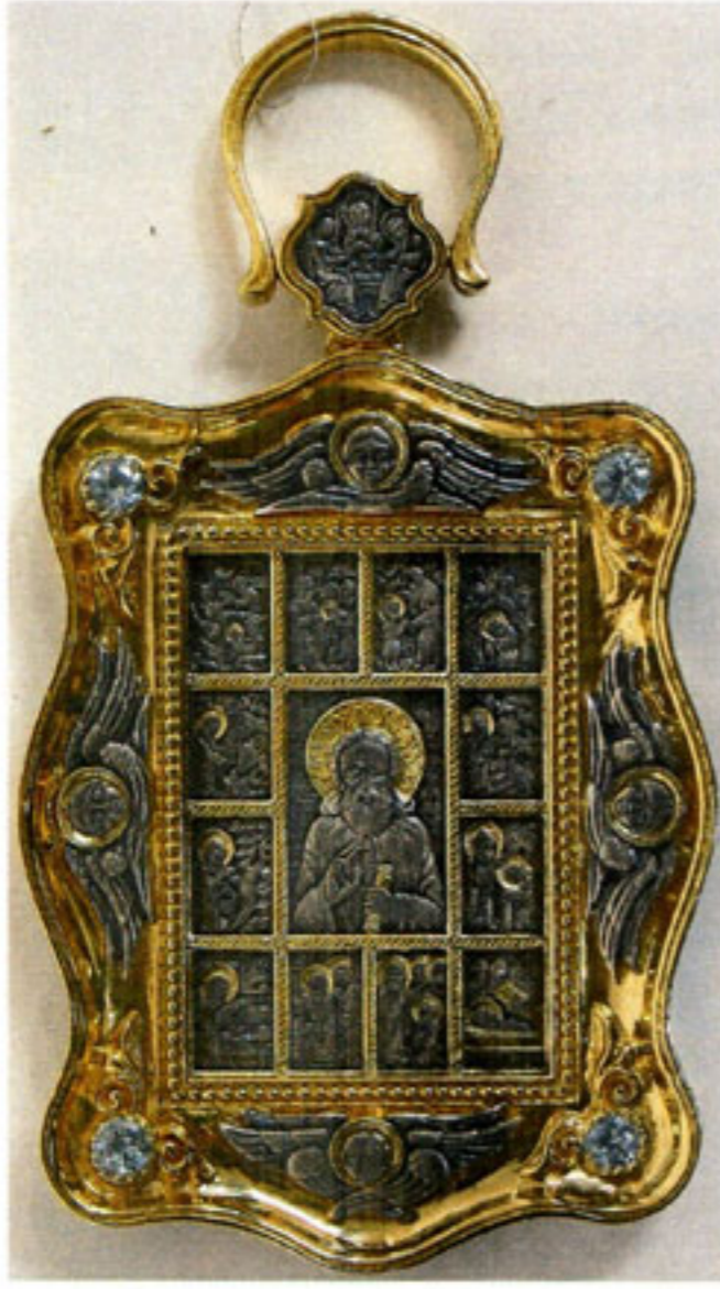
Икона кабинетная на подставке Святой преподобный Сергей Радонежский в житии 2010

Автор модели: Владимир Михайлов (Боровичи) Материалы, техника исполнения: серебро 975 пробы, золочение, литьё, монтировка